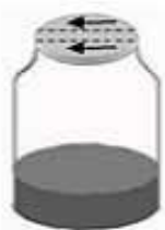
按箭头方向打开西林瓶盖

将疑是大肠埃希氏菌 O157: H7 的新鲜菌苔置于已配备的无菌生理盐水中, 与 0.5 McFarland 的浊度管比浊, 将菌悬液制备成 0.5 McFarland (约 10^8 cfu/mL), 37°C 培养 18—24h, 用吸管吸取 2 滴 (约 0.06 mL) 菌悬液加入每种微量生化管内。 将已接种的西林瓶再套上胶塞, 一般采用全加塞 (如图 2 左两瓶所示), 特殊情况在下表注明采用半加塞 (如图 2 右两瓶所示), 直立于内托的凹槽内 (如图 2), 或放置于合适的瓶架中, 于 35—37°C 培养箱中培养, 结果观察见表 1。注意: 如有特殊的接种方式、培养时间或培养方式, 请详见每种生化鉴定管附带的使用说明。